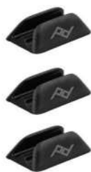
Klipy pro vedení nabíjecího kabelu x3