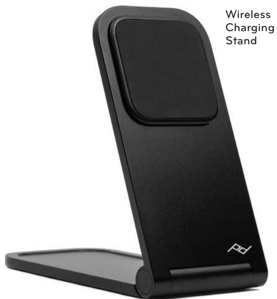
Wireless Charging Stand

vyžaduje kryt Peak Design nebo MagSafe telefon/kryt není součástí balení