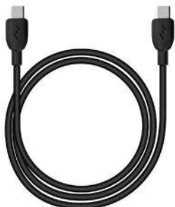
USB-C na USB-C napájecí kabel (2m)

vyžaduje síťový adaptér USB-C není součástí balení