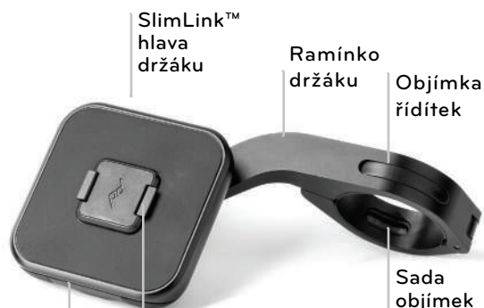
SlimLink™ hlava držáku