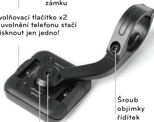
Šroub objímky řídítek

Uvolňovací tlačítko x2 K uvolnění telefonu stačí stisknout jen jedno!