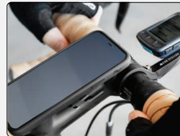
Reverse | Portrait