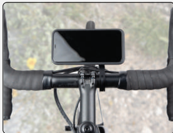
Out-Front | Landscape