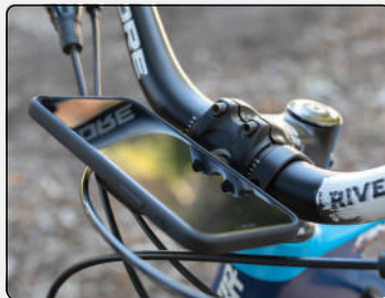
Flush | Landscape