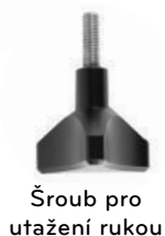
Šroub pro utažení rukou