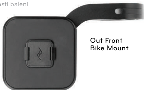
Out Front Bike Mount

vyžaduje kryt Peak Design Everyday Case není součástí balení