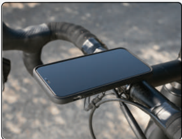
Out-Front | Portrait

Připevněte telefon podle svého stylu jízdy.